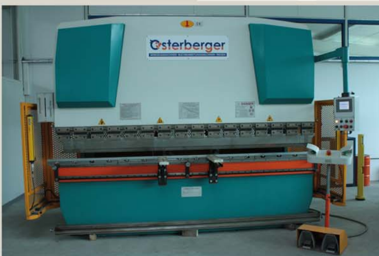
CNC Abkantpresse Kant- und Umformarbeiten Abkantlänge 3200mm Presskraft 1250 KN