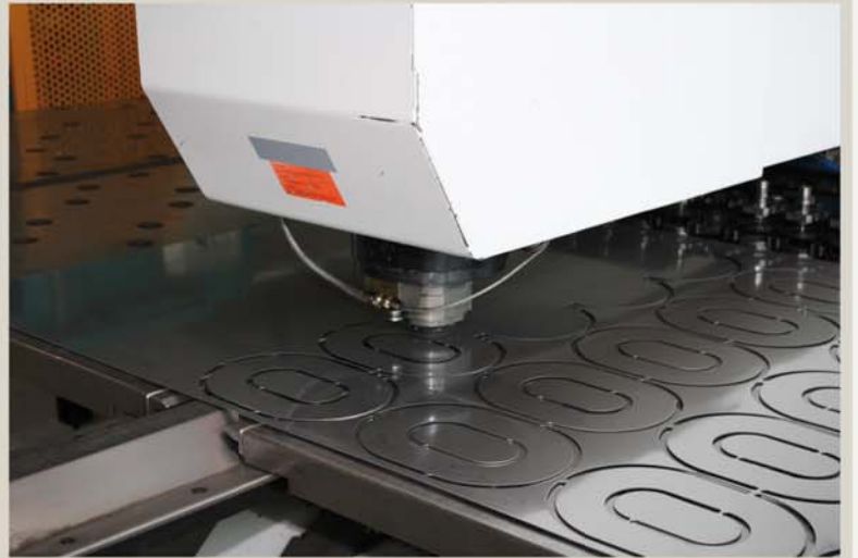
CNC Stanznippelmaschine Stanz- und Nippelarbeiten, Umformen und Prägen max. Blechstärke 4mm