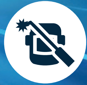
SCHWEIßARBEITEN WELDING WORK