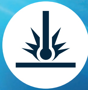
LASERSCHNITT LASER CUTTING