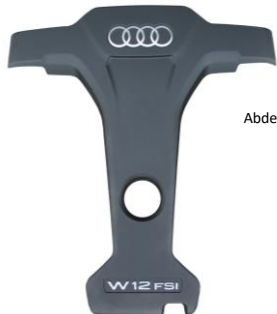
Abdeckung Audi S8