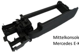
Mittelkonsole Mercedes E-Klasse