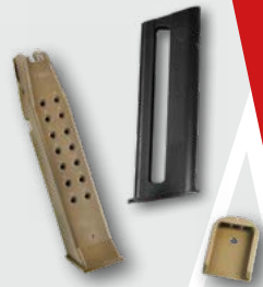
Magazine / Magazinschuh

Wir liefern hochpräzise Kunststoffteile, die in verschiedenen Bereichen der Waffenherstellung zum Einsatz kommen. Unsere Produkte zeichnen sich durch ihre Präzision aus, was sie ideal für die hohen Anforderungen unserer Kunden macht.