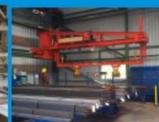
Konsolkommissionierkran mit Magnethebeeinrichtung