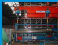
Konsolkommissionierkran mit Tandemkettenzugbetrieb und Vakuumhebetrasse