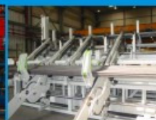
Bundformer mit Schrägaufzug zur Waage