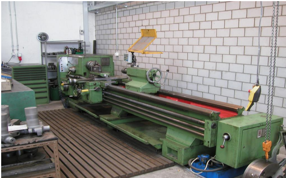
Drehbank Boehringер VDF mit Digitalanzeige

Spitzenlänge: 2'500 mm Spitzenhöhe ü. Bett: 300 mm Spitzenhöhe ü. Schlitten: 200 mm