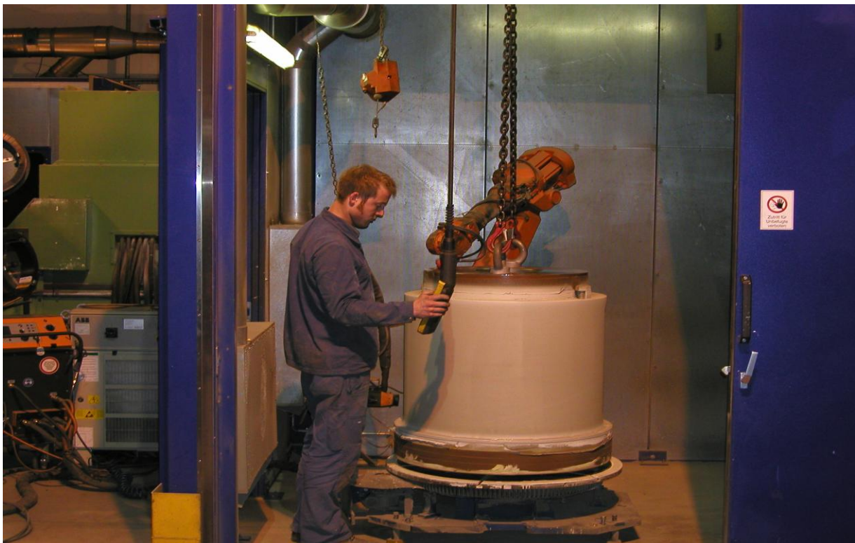
Achse Beschichtet mit Lagermetall WM89

ABB Roboter: 7-Achsen Drehbank: D-700 x 4'500mm Stückgewicht: max. 5t