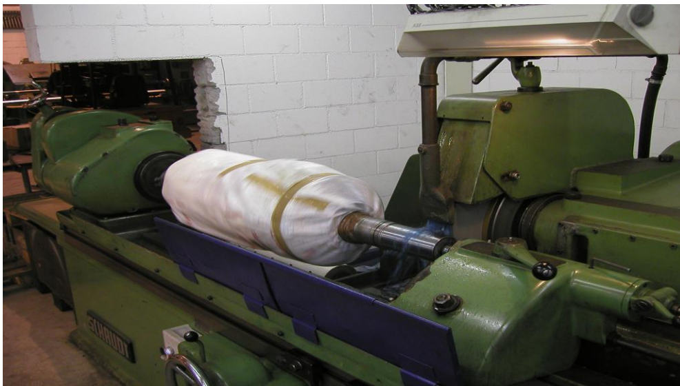
Beschichteter Sitz an Rotor Rundschleifen

Spitzenlänge: 1'500 mm Spitzenhöhe: 200 mm