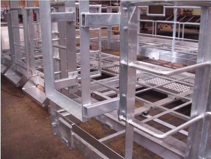
Beispiele für Industriemontagen