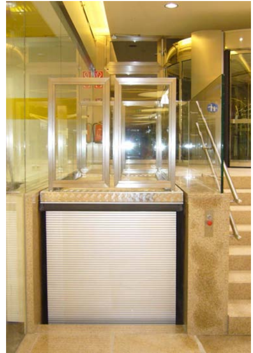
Beispiele aus unserer Edelstahlverarbeitung. Schraub und Schweißverbindungen