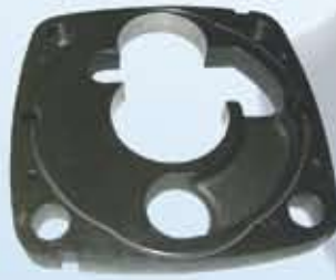
Hydraulische Steuerplatte 400 mm x 400 mm