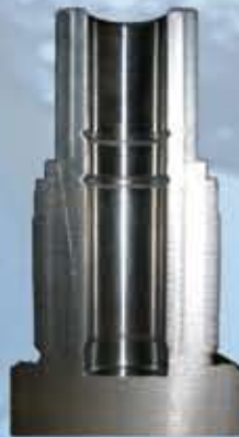
Pumpenzylinder Ø 370 mm Länge 600 mm