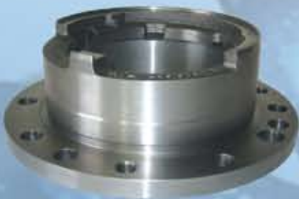
Lagerflansch Ø 300 mm