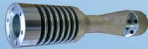
Kühlgehäuse Ø 90 mm Länge 420mm