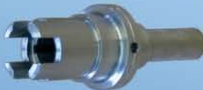
Spulendornrotor Ø 50 mm Länge 120 mm Keilbahn gestossen