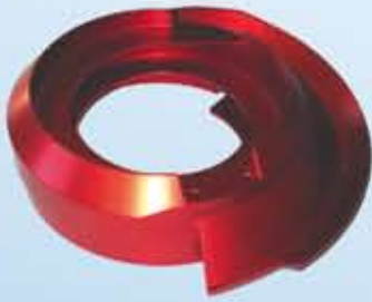
Fördertopf Ø 300 mm