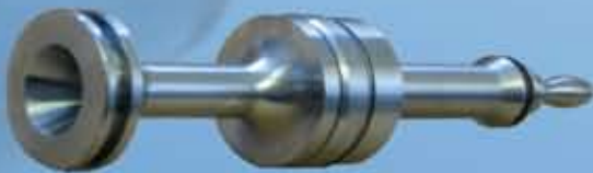
Kolben Ø 30 mm Länge 250 mm