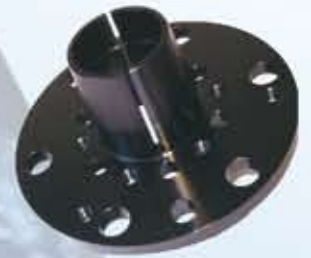
Blockierflansch Ø 300 mm